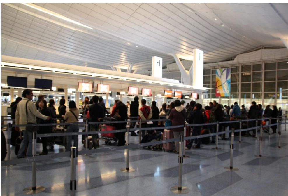
搭乗手続き開始を待つ列はこの後も長くなる