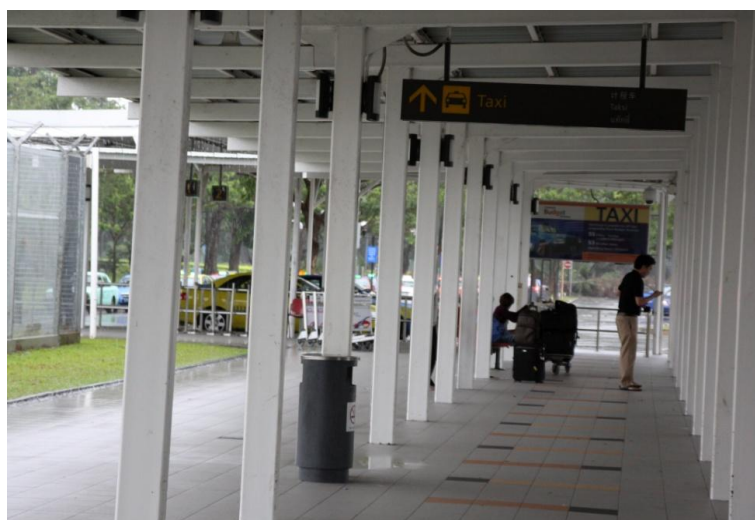
雨のタクシー乗り場にはヨーロッパの風情がある