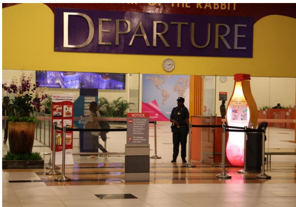
出発旅客はここから入って保安検査を受ける