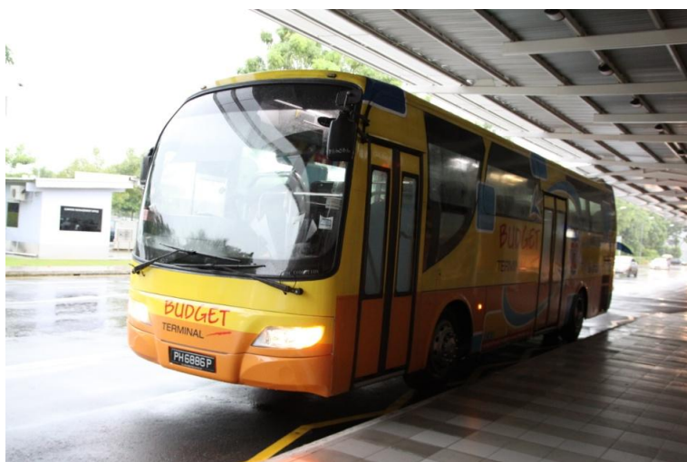
黄色の塗装が分かりやすいメインターミナル行きシャトルバス