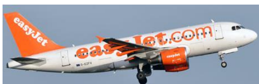
(easyJet の A319 型機材)

両社の決算期間は半年ズレている (Ryanair ; 3月期、easyJet ; 9月期) ことから、比較は主に入手データが整っている2016年度 (2017.3月期と2017.9月期) で実施。2014年で当研究所で実施した調査研究結果の一部も使用しています。